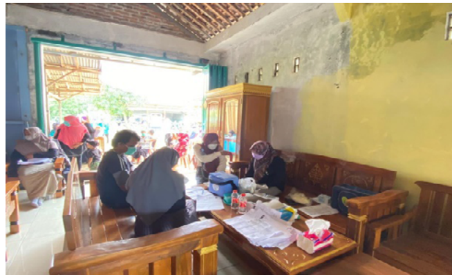
Gambar 1. Vaksinasi Warga Rt. 03 Rw. 02

vaksinasi Covid-19 dengan baik. Dan sudah banyak yang melakukan vaksin sampai tahap Booster . Artinya bahwa kesadaran masyarakat Desa Ayah mengenai pentingnya vaksinasi Covid-19 bagi kesehatan sudah melekat pada diri masyarakat.