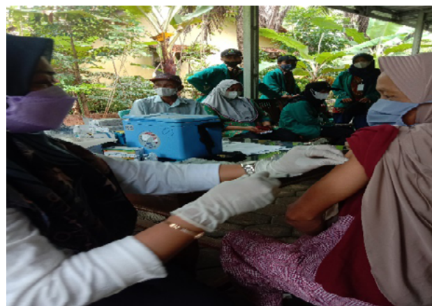
Gambar 3. Vaksinasi di Dusun Gua Petruk Rt. 04 Rw. 01 Desa Ayah