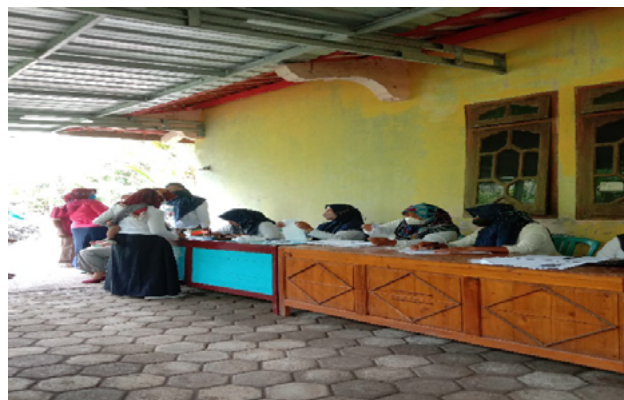
Gambar 2. Prosesi isi daftar hadir, pengisian data, ukur lingkaran perut, timbang badan, dan tinggi badan.