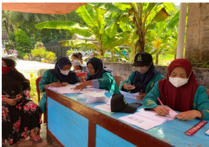
Gambar 05. Proses daftar hadir peserta vaksin dan penginputan BB, TB dan LP.