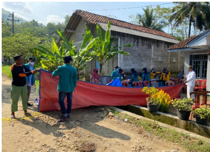
Gambar 04. Persiapan Tempat Vaksin di Desa Ayah Dekat Pantai Logending Rt. 04 Rw. 02